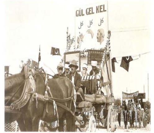
Faytonun üstüne yerleştirilmiş levhada eski harflerle aynı şekilde yazılan üç kelimenin yeni harflerle yazıldığı yer alıyor.